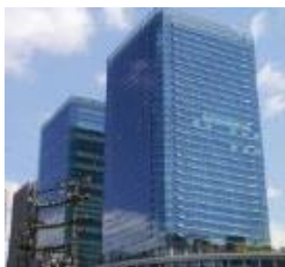
大阪支社が入るグランフロント大阪