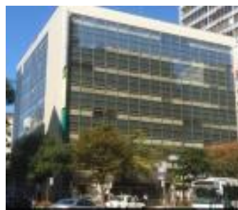
福岡支社が入る天神三井ビル