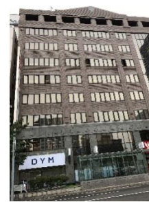
札幌支社が入るKDX札幌ビル