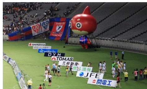
※株式会社 DYM は FC 東京のクラブスポンサーです