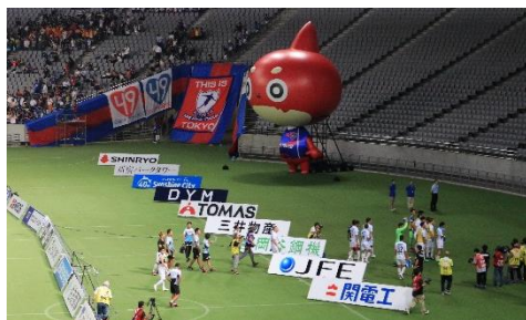
※株式会社 DYM は FC 東京のクラブスポンサーです