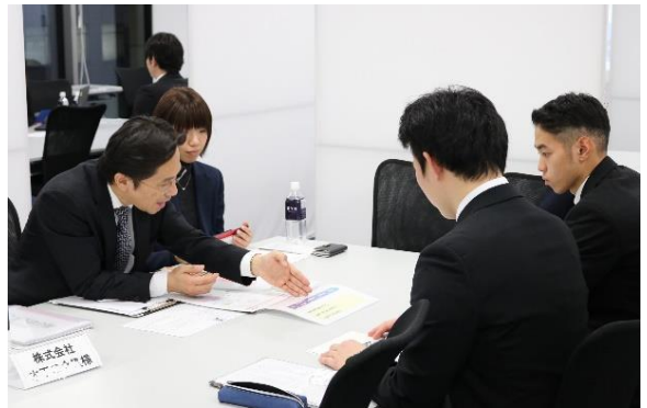
書類選考なしで、社長や人事責任者と直接話ができる

2020 卒向けのイベントでは地方でのサービス拡大にも注力し、全国30カ所（札幌、秋田、仙台、福島、新潟、金沢、岐阜、長野、東京、茨城、千葉、横浜、平塚、大宮、宇都宮、高崎、静岡、名古屋、三重、和歌山、京都、大阪、神戸、広島、高松、岡山、松山、福岡、熊本、沖縄）での開催を予定しています。また、2021 卒向けのイベントでは、さらに開催場所を増やし、サービス拡大を図ります。