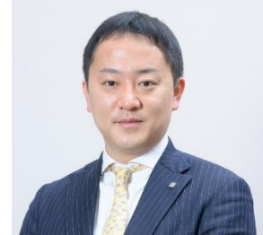
株式会社 DYM 人材事業部

「社会の将来への見通しが難しくなっている今、若手社員の就職意識は“終身雇用”から“転職が当たり前”の時代となっています。その中で男性は、成長ができる環境で、自分自身に力を付けたいという気持ちが大きいのではないかとと言えます。また、女性は、結婚・出産などのライフイベントに備えたいという気持ちから、社風や人柄、フィーリングで会社を見る傾向にあるのではないのでしょうか。新入社員へのフォローを行う中で、企業は、福利厚生や給与だけでなく、あらゆる方面から自社の魅力を語れるようにしておく必要があるでしょう。」